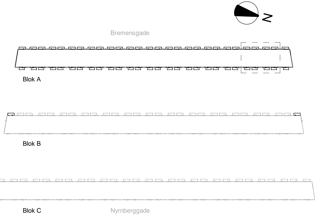
Bygningsudsnit af Blok A - øst- og vestvendt facade Østvendt facade har altaner i stueetage